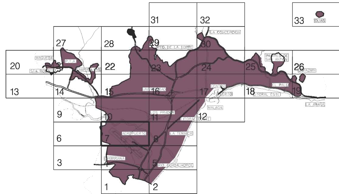
GRAFICO DISTRIBUCION DE HOJAS